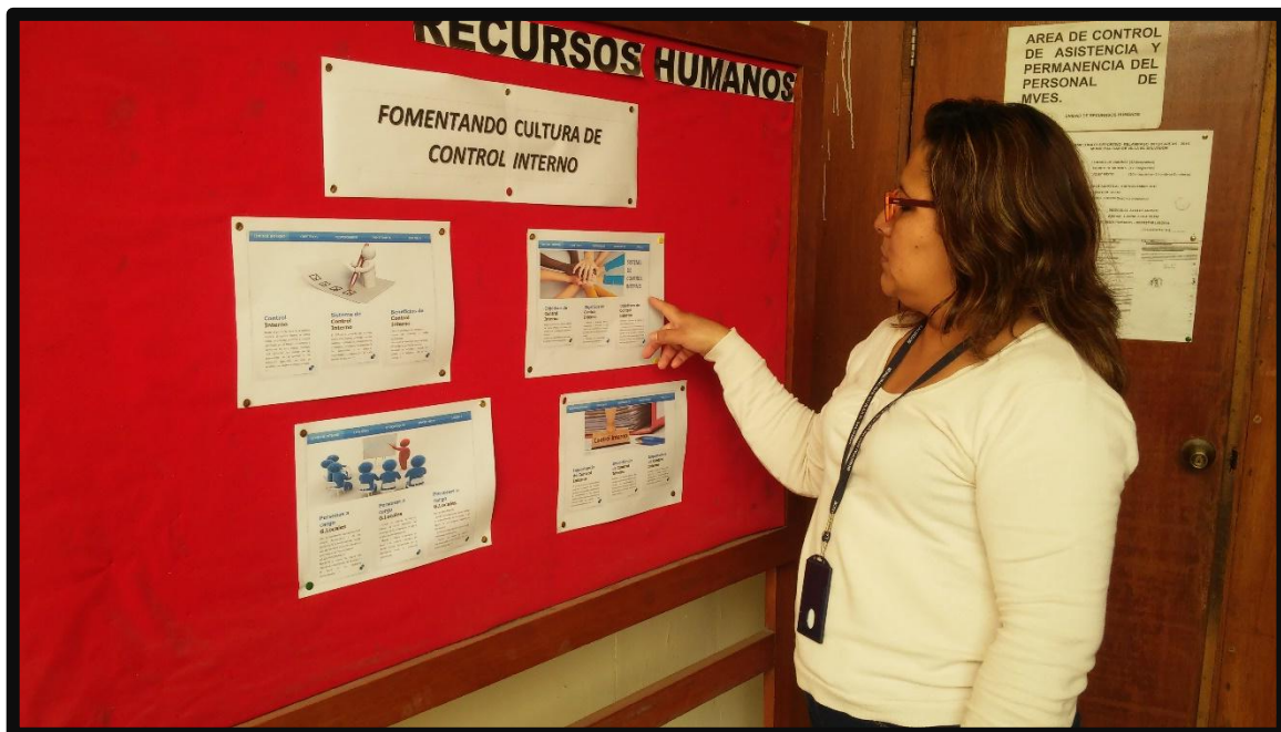
Personal de la Municipalidad se informa respecto al Sistema de Control Interno