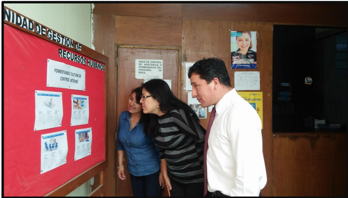
Personal de la Municipalidad se informa respecto al Sistema de Control Interno